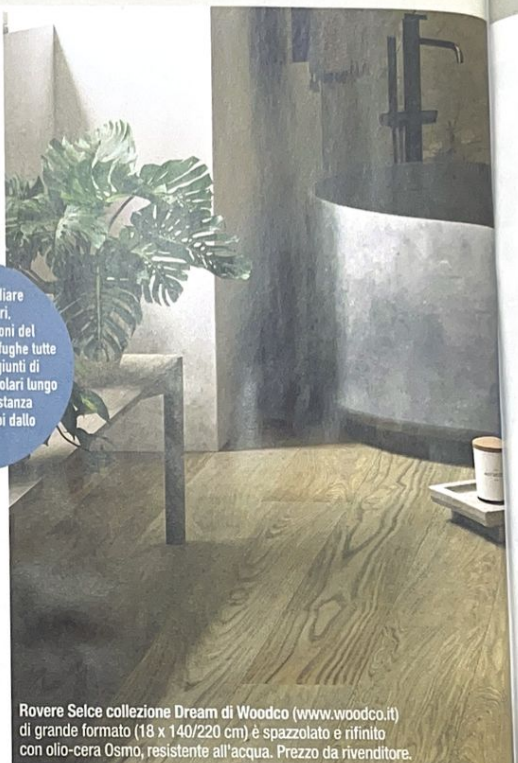
Rovere Selce collezione Dream di Woodco ( www.woodco.it ) di grande formato (18 x 140/220 cm) è spazzolato e rifinito con olio-cera Osmo, resistente all'acqua. Prezzo da rivenditore.