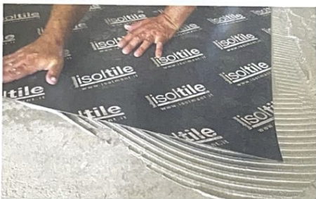
↑ Lo strato fonoisolante a basso spessore (2 mm) IsoTile di Isolmant ( www.sistemapavimento.it ), sotto-pavimento, è adatto anche per sistemi radianti, per posa a colla, flottante o ibrida. Prezzo da rivenditore.

È importante studiare bene gli incastri, seguendo le istruzioni del fornitore, e prevedere fughe tutte regolari. Eventuali giunti di dilatazione e tagli irregolari lungo il perimetro della stanza vengono coperti poi dallo zoccolino.