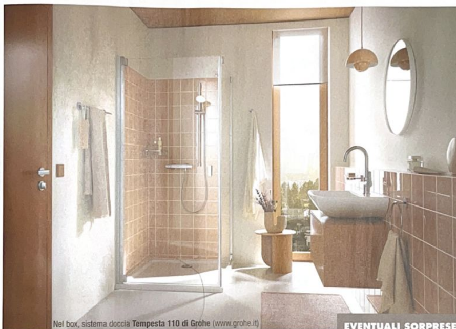
Nel box, sistema doccia Tempesta 110 di Grohe ( www.grohe.it )

... in sostituzione della vasca, in modo semplice e veloce . Ecco i suggerimenti e le fasi operative di un intervento tradizionale per realizzare una postazione più dinamica, bella e funzionale