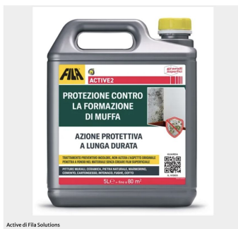
Active di Fila Solutions

Per avere edifici protetti e ambienti salubri bisogna prevenire il degrado causato da acqua e agenti atmosferici. Infatti, se non viene risolto il problema, la muffa rende gli ambienti malsani che, con il tempo, possono portare a problemi respiratori, infiammazioni o allergie. Importante è quindi utilizzare soluzioni efficaci come i prodotti liquidi, che offrono risultati professionali.