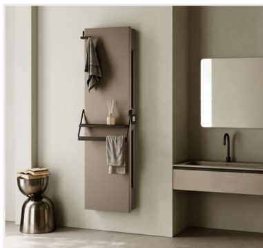
Ventana Vertical versione Baden di Cordivari Design

La Serie Vertical di Cordivari Design comprende radiatori di design ad alte performance termiche, a sviluppo verticale per caldo & freddo, utilizzabili tutto l'anno. Due le versioni: Ventana Vertical e Run Vertical , entrambi adottano innovative soluzioni aeruliche, elettroniche evolute, motori brushless DC inverter e sono ideali in abbinamento a impianti a pompa di calore. Una griglia invisibile permette la ventilazione laterale brevettata, massimizzando prestazioni e comfort con un flusso d'aria silenzioso. Il design è minimal ed elegante , personalizzabile in oltre 80 colori della cartella Colour System Cordivari Design, scegliendo tra tinte lucide, opache e materiche. La versione "Baden" è specifica per l'ambiente bagno e dotata di una barra accessori. Tramite app da smartphone si può gestire il funzionamento. http://www.cordivaridesign.it