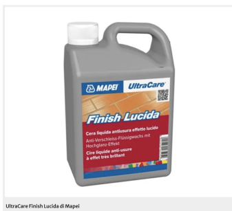
UltraCare Finish Lucida di Mapei

Le superfici in cotto, pietre e marmi vanno protette con prodotti idonei, per evitare che siano danneggiate da macchie di varia natura. Importante scegliere prodotti di qualità, pratici da usare e studiati appositamente per questi materiali, per assicurare una protezione duratura ed efficace.