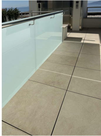
Progress Profiles | Dettaglio della terrazza