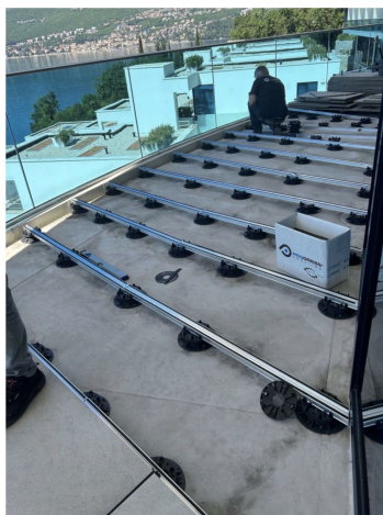
Progress Profiles / Posa su un sistema sopraelevato a piedistalli in polipropilene regolabili

A questo scopo l'hotel si è affidato alla professionalità dei tecnici Progress Profiles e alle soluzioni innovative offerte dall'azienda. Attiva a livello mondiale nella produzione di profili di finitura tecnici e decorativi e di sistemi di posa per l'edilizia e l'interior design.