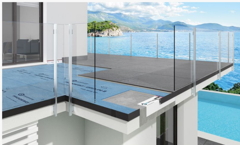
Le soluzioni combinate Progress Profiles per terrazzi e balconi.

Esposti alle intemperie, terrazzi, balconi e verande subiscono molti danni. Progress Profiles offre una soluzione innovativa per ripristinare, migliorare e progettare sin da subito pavimenti esterni più durevoli. Per spazi all'aperto perfetti in ogni stagione.