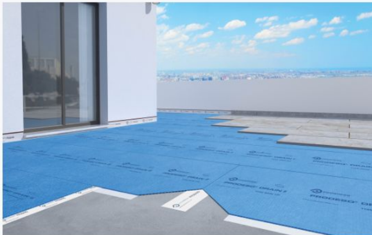
Una visualizzazione della posa di Prodeso® Drain 8 System su un terrazzo

La membrana Prodeso® Drain 8 System ha anche il pregio di essere pratica e veloce da installare – e dunque può essere un prezioso alleato anche in interventi migliorativi. Per facilitare i posatori al momento della messa in opera, si completa con una bandella in polietilene e polipropilene elastico e con un adesivo bicomponente impermeabile.