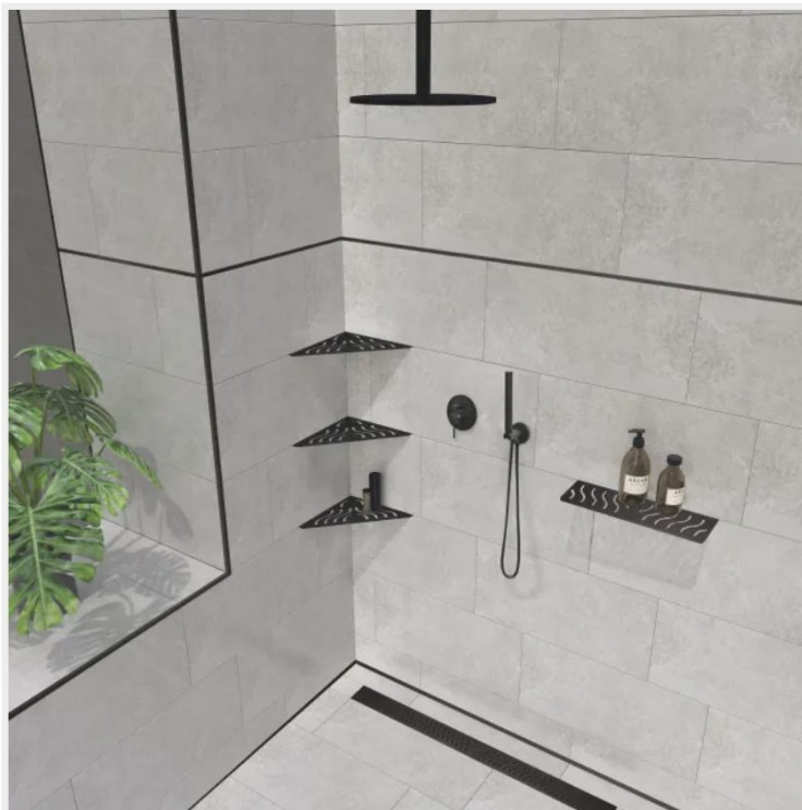
Proshower Base L Pro di Progress Profiles

Proshower Base L Pro di Progress Profiles è la canalina di raccolta per piatto doccia in acciaio inox con sifone orientabile a 360° e facilmente ispezionabile. Disponibile in diverse lunghezze, è completata da 3 differenti griglie in acciaio inox. Nella foto la griglia è nella finitura Black Line. Prezzo per la lunghezza di 30 cm 250 euro.