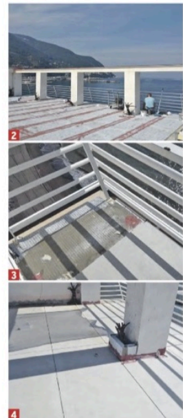
1-2-3-4. Sequenza dei lavori effettuati sulla copertura piana dell'Hotel Miramare, che si affaccia sul golfo di Napoli a Castellammare di Stabia, utilizzando la membrana Prodeso sul massetto con adesivo classe C2TE e la protezione Proterrace Drain FDP bianco raccordato alla guaina Prodeso con Proband 150.

Forte di oltre 30 anni di attività, il brand Progress Profiles è riconosciuto a livello mondiale e raggiunge oltre 60 paesi, offrendo una gamma di 13.000 articoli. Tuttavia, sebbene il mercato estero registri una significativa quota del 34% di fatturato, consolidato dall'apertura di sedi a Melbourne, Dubai e Randolph, nel New Jersey, il cuore pulsante rimane in Italia. È dal nostro paese infatti che parte la ricerca e l'innovazione che esporta le soluzioni Made in Italy nel mondo.