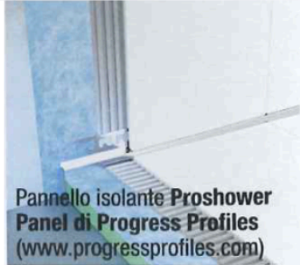
Pannello isolante Proshower Panel di Progress Profiles ( www.progressprofiles.com )