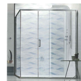
Il modello 66 di ACE Living Shower (www.aceliving.com) con pannello in plexiglass e porta in alluminio. La serie 67 include anche la porta in vetro e la distanca regolabile Proshower Profile (www.progressprofiles.com). Il pannello in plexiglass è disponibile nei formati personalizzati con tagli in misura. Colore: 1.600 euro.