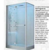
La distanca Proshower Profile (www.progressprofiles.com) è un accessorio per il modello 66 di ACE Living Shower (www.aceliving.com) che garantisce la perfetta tenuta e il drenaggio ottimale dell'acqua. Il pannello in plexiglass è disponibile nei formati personalizzati con tagli in misura. Colore: 1.600 euro.