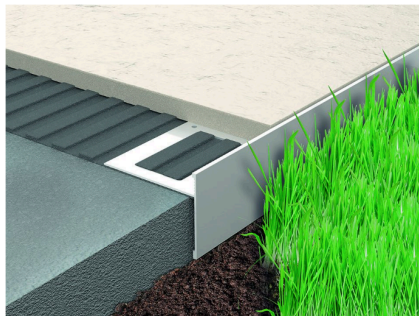
Profilo in alluminio goffrato Proside Walk.

Per rinnovare in modo semplice e veloce le aree esterne come bordo piscina e passaggi pedonali, Prosupport System è un sistema brevettato di supporti modulari e regolabili per pavimenti sopraelevati in ceramica, legno e materiali compositi . Senza demolire la vecchia pavimentazione, la struttura sospesa è facile da posare, facilmente ispezionabile e adattabile alle diverse esigenze climatiche.