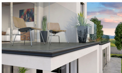
Proterrace per il corretto deflusso delle acque.

Per i vialetti d'ingresso, i passaggi pedonali e i marciapiedi esterni, si tratta di un profilo in alluminio verniciato goffrato che salvaguarda il massetto e i bordi delle piastrelle, donando un tocco di eleganza.