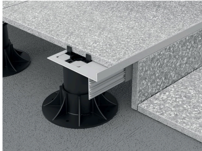
Dettaglio del profilo con alette inclinate del sistema Prosupport.