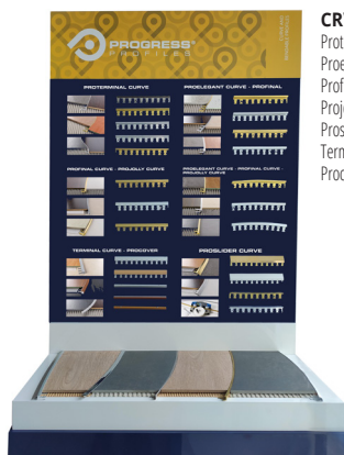
CRV: Proterminal curve, Proelegant curve, Profinal curve, Projolly curve, Proslider curve, Terminal curve, Procover;