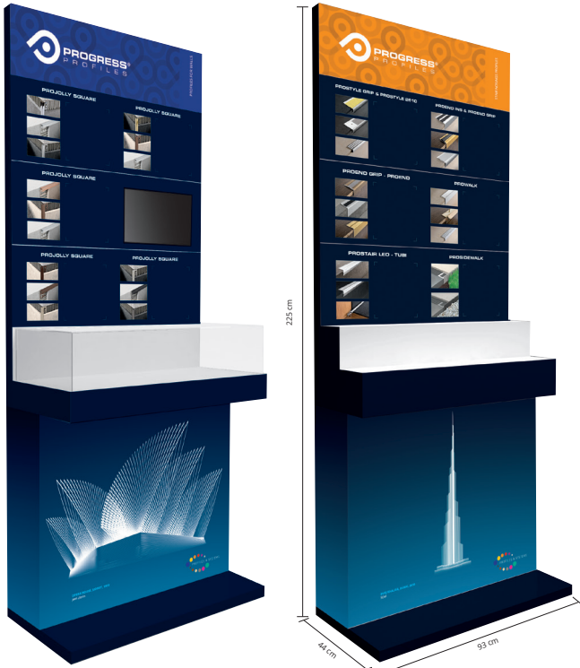
EXPOSITOR MODULAR CON VIDEO

El SISTEMA EXPOSITIVO MODULAR CON PANELES INTERCAMBIABLES es constituido por una base de metal como soporte, de altura 225 cm, ancho 93 cm y profundidad 44 cm. A esta estructura se fijan paneles con ejemplos de colocación de perfiles y muestras de los productos. En la parte central hay una repisa con un ejemplo de ambientación (modelo) de los perfiles más difundidos expuestos en los paneles. Gracias a las fotografías de ambientaciones, a las muestras de perfiles y al modelo, el sistema modular permite al cliente de haber una visión de conjunto de las posibilidades de uso de los productos y sistemas de Progress Profiles. Gracias a la facilidad de montaje y al tamaño pequeño, el sistema expositivo puede adaptarse a todos show room y punto de venta. Gracias a la modularidad de los paneles, se pueden elegir los productos para promocionar. El sistema es fácilmente renovable y adaptable para ser actualizado y con nuevos acabados y productos.