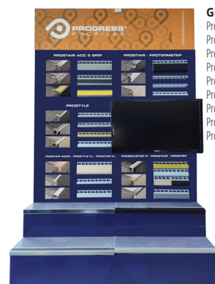
GR1: Prostair acc Prostair kl, Prostair grip, Prostair wood, Protermstep, Prostyle, Prostyle kl, Probrastep, Prostep;