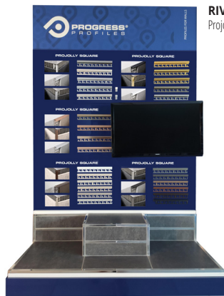
RIV 2: Projolly square;