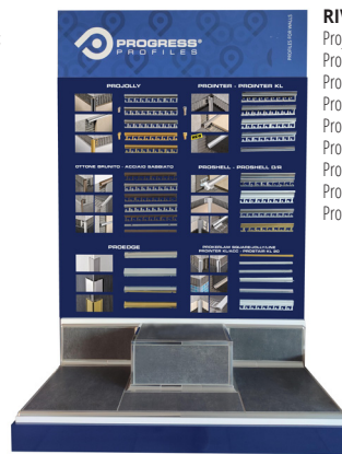
RIV 3: Projolly, Prointer, Prointer kl, Proshell, Proedge, Prokerlam square, Prokerlam jolly, Prokerlam line, Prostair kl;