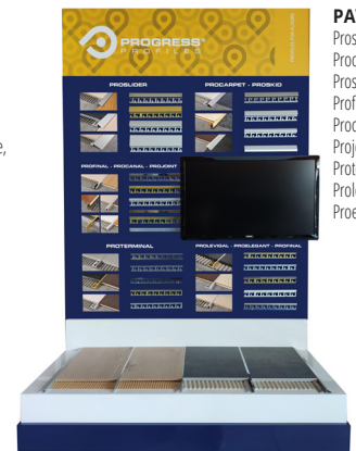
PAV 1: Proslider, Procarpet, Proskid, Profinal, Procanal, Projoint, Proterminal, Prolevigal, Proelegant;