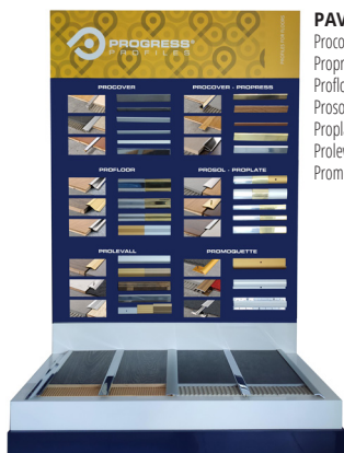
PAV 2: Procover, Propress, Profloor, Proslat, Proplate, Prolevall, Promoquette;