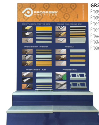
GR2: Prostyle grip, Prostyle 2610, Proend ins, Proend grip, Prowalk, Prostair led, Proside walk;

* = Producción a petición. Tiempo de producción 4/5 semanas, precio a convenir.