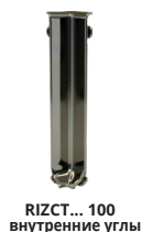
RIZCT... 100 внутренние углы