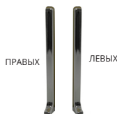
TRZCT... 100/3 пробки