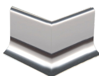
RE... 40/... raccordo esterno