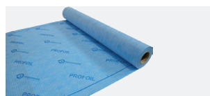
PROFOIL PFLO 0405