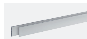
PROFILO IN ALLUMINIO PIAA 40212