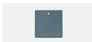
SPATOLA PRSPD 10