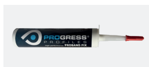
PROBAND FIX PRBFXB