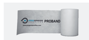
PROBAND 150 PRBPE 1507