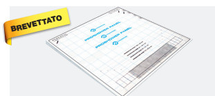
PROSHOWER PANEL LINEAR PSHPAN