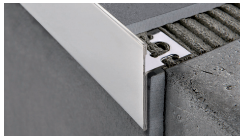
ACIER INOX AISI 304/1.4301-V2A POLI avec film de protection longueur b. 2,7 ML - cond. 15 Pces - 40,5 ML