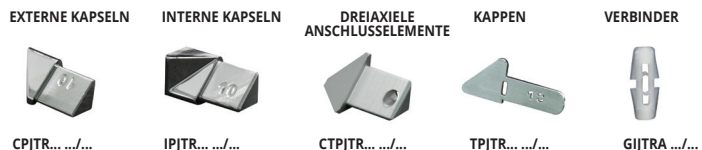
CPJTR... .../... IPJTR... .../... CTPJTR... .../... TPJTR... .../... GIJTR... .../...

ART. NUR IN GANZEN VERPACKUNGSEINHEITEN ERHÄLTlich