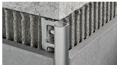
ACCIAIO INOX AISI 304/1.4301-V2A SATINATO con pellicola protettiva lunghezza barre 2,7 ml - conf. 20 PZ - 54 ml (H 4,5 mm - 108 ml) - 10/10 mm