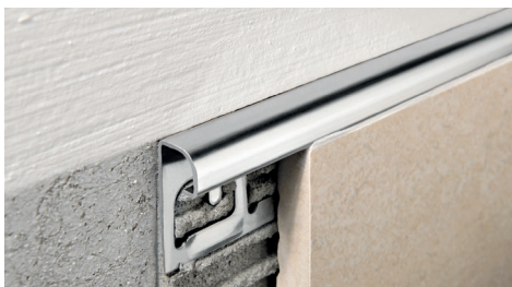
ACCIAIO INOX AISI 304/1.4301-V2A LUCIDO con pellicola protettiva lunghezza barre 2,7 ml - conf. 20 PZ - 54 ml (H 4,5 mm - 108 ml) - 10/10 mm