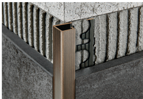
OTTONE SPAZZOLATO thermo packed lungh. barre 2,7 ml - conf. 20 PZ - 54 ml