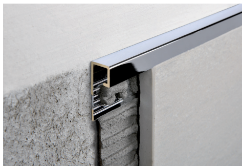
OTTONE CROMATO thermo packed lungh. barre 2,7 ml - conf. 20 PZ - 54 ml

OTTONE CROMATO, SPAZZOLATO E OTTONE BRUNITO