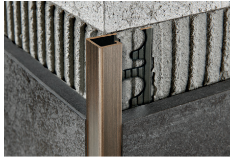
GEBÜRSTETES MESSING Thermoverpackung Stangenlänge 2,7 Lfm - VE 20 Stk. - 54 Lfm