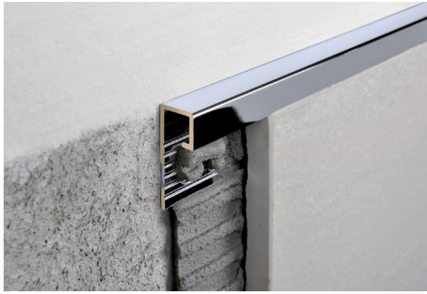
MESSING VERCHROMT Thermoverpackung Stangenlänge 2,7 Lfm - VE 20 Stk. - 54 Lfm

MESSING VERCHROMT GEBÜRSTET UND BRÜNIERTES